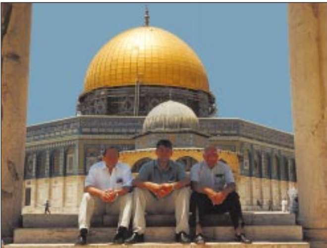
طاقم الطبي أمام قبة الصخرة.