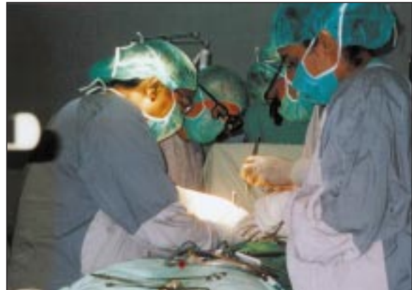
صورة أثناء عملية جراحية قلبية مع زملاء المركز.

قام الدكتور فيضي عمر محمود رئيس اللجنة العلمية لاتحاد الأطباء العرب في أوروبا بزيارة الى اليمن في الفترة ما بين ٩-٦١ نيسان ٢٠٠٢ بدعوة من وزارة الصحة اليمنية الى مستشفى الثورة النموذجي الى مركز جراحة القلب الذي أفتتح في صنعاء عام ٢٠٠٠ وهو المشفى الوحيد في اليمن والتي تجري فيها عمليات القلب المفتوح والتي لا زالت في مرحلة البداية ويتألف المركز من قاعة واحدة للعمليات مجهزة بتجهيزات جيدة وتقنيات عالية وقسم خاص للعناية المشددة ٦ أسرة وحدة خاصة لأجراء القسطرة القلبية بالإضافة الى جناح المرضى للرجال والنساء، وانه من المتوقع في آخر عام ٢٠٠٢ توسيع المركز وإضافة غرفتين أخريين للعمليات ، بالإضافة الى الزملاء اليمنيين الذين يمارسون العمل في المركز يوجد طاقم طبي من الهند مؤلف من الأطباء الجراحين والمخدرين والعاملين في جهاز القلب الرئوي