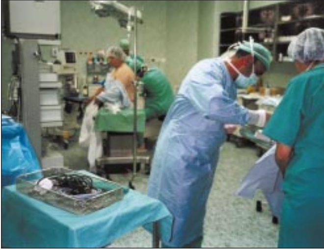
طاقم الطبي يجري عمليات.