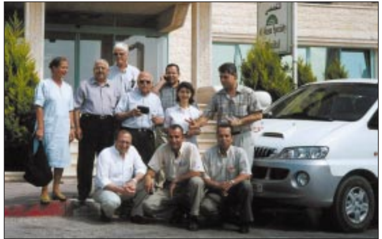
طاقم الطبي مع عناصر من الهلال الأحمر الفلسطيني وزملاء من المستشفى.