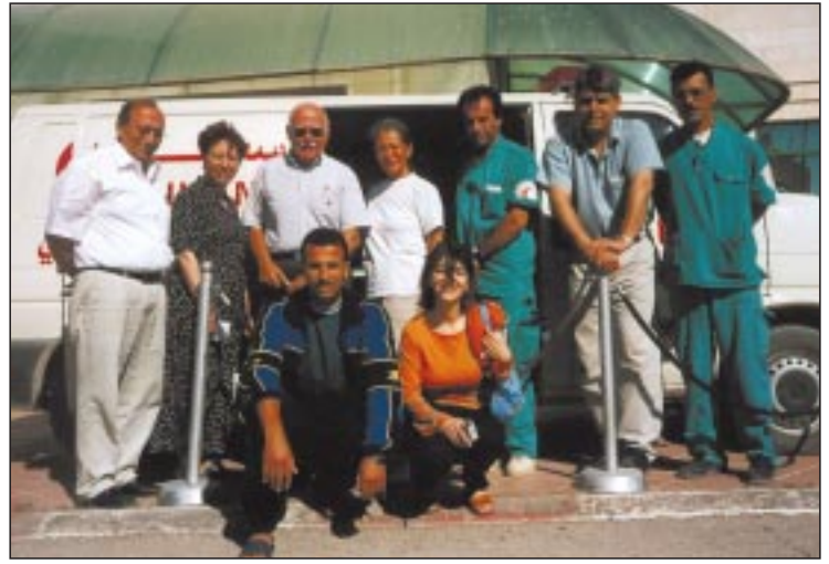
طاقم الطبي مع عناصر من الهلال الأحمر الفلسطيني وزملاء من المستشفى.