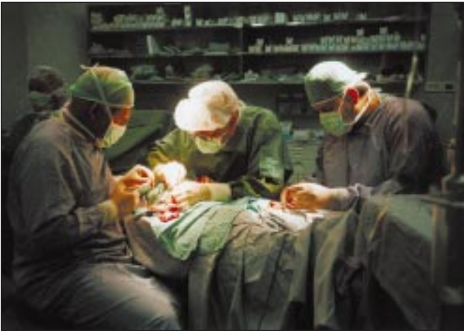
طاقم الطبي يجري عمليات.