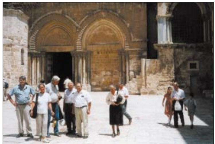
طاقم الطبي في كنيسة القيامة.